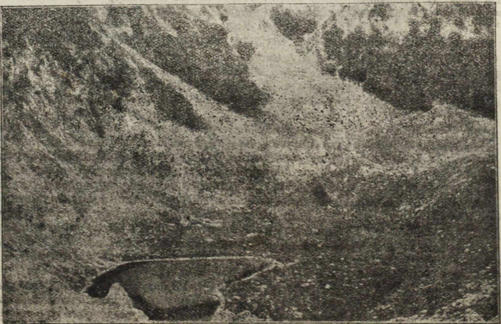
ГЛЕЧЕРСКО ЈЕЗЕРО ПОД ДУРМИТОРОМ