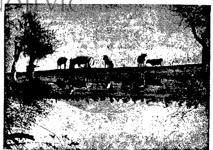
МОТИВ ИЗ ЗЕТЕ