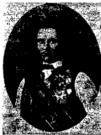
Кнез Данило I

Ето ви шљем писмо на Никшћу, да које мислим да се здоговарате око састанка и бићете већ углавни. Те, (који) побу на састанк, те их пошљете, ја се н дам да ће доћ ође у Острог, аа то покороно молим да ми пиште