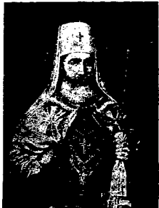
Петар I — Свети