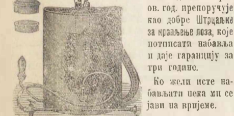
Петар Дреџун механик П. п. Бр. 107. 3,5