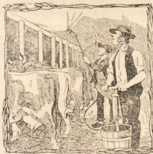
МАЗАЊЕ ЈЕДНЕ ШТАЛЕ

МАШИНА ЗА БРЗО МАЗАЊЕ И ДЕЗИНФЕКЦИРАЊЕ СТЕРНАН 's „FIX“